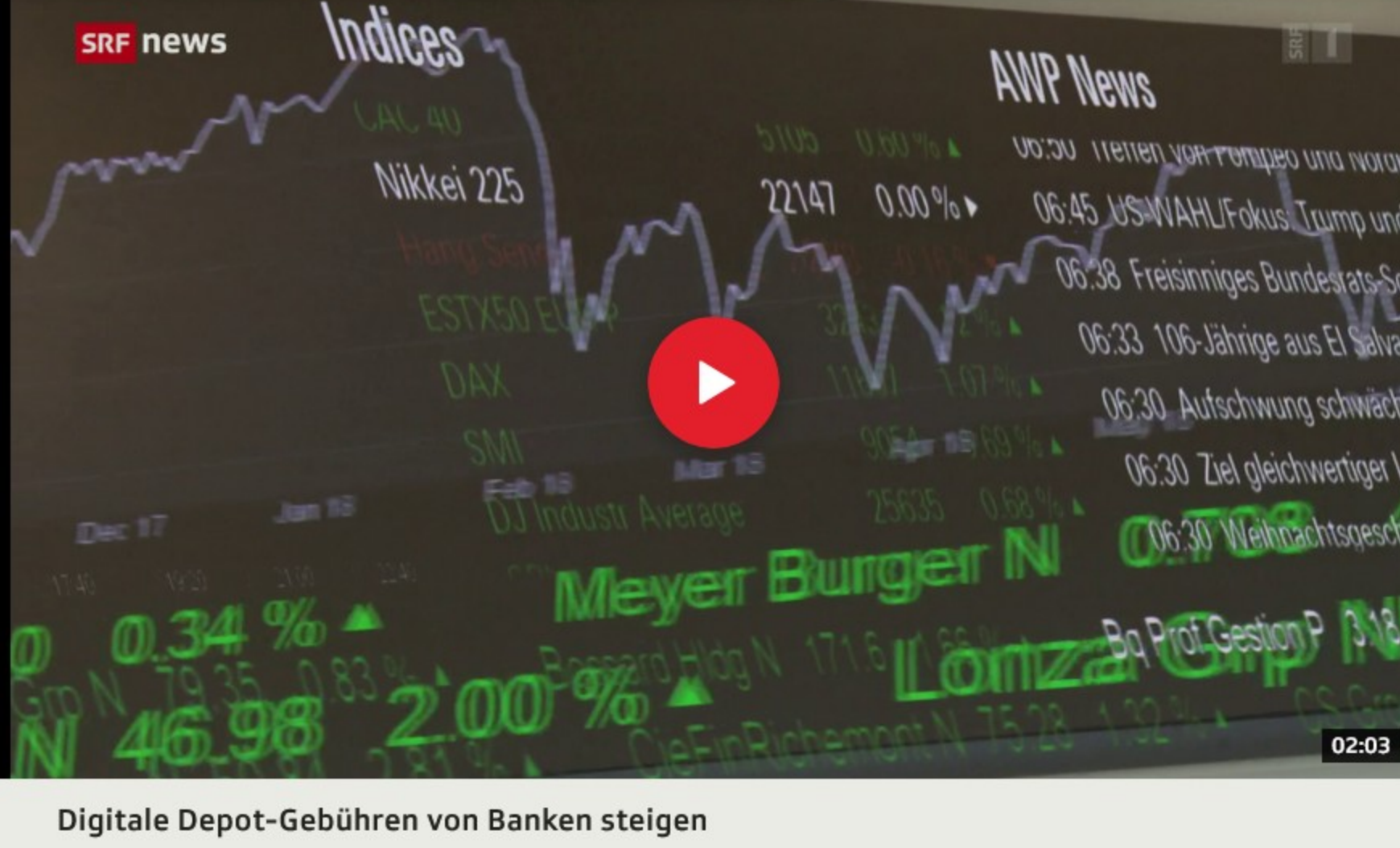
Digitale Depot-Gebühren von Banken steigen Aus Tagesschau vom 20.05.2023.