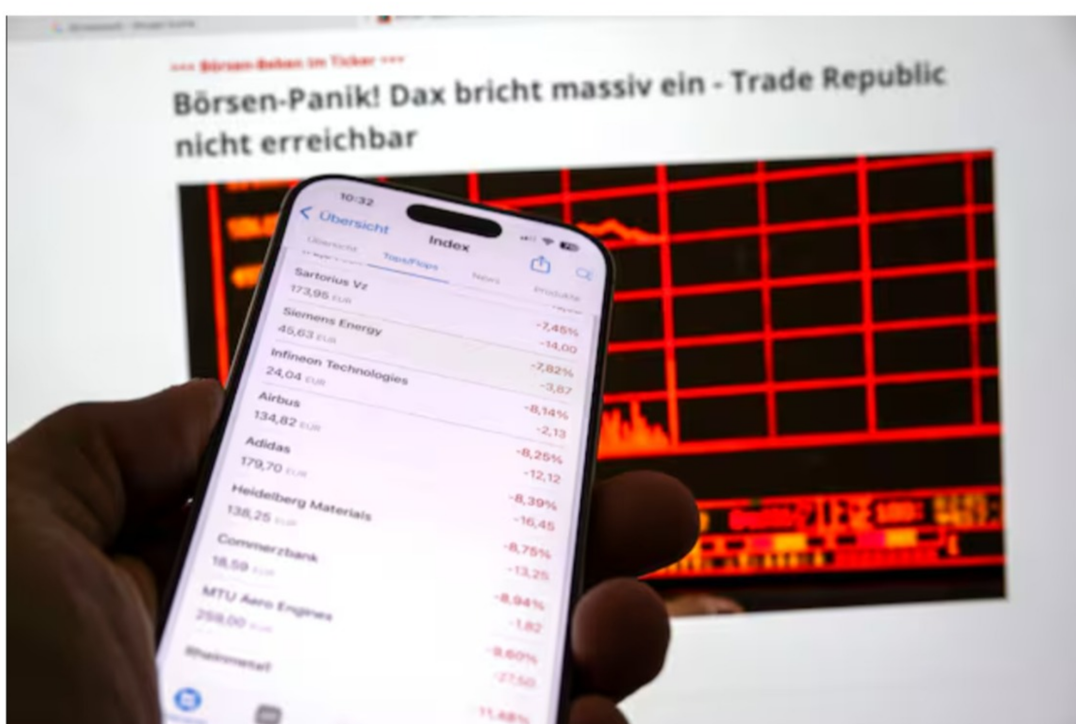
Immer mehr Menschen traden heutzutage mit dem Smartphone (Symbolbild).