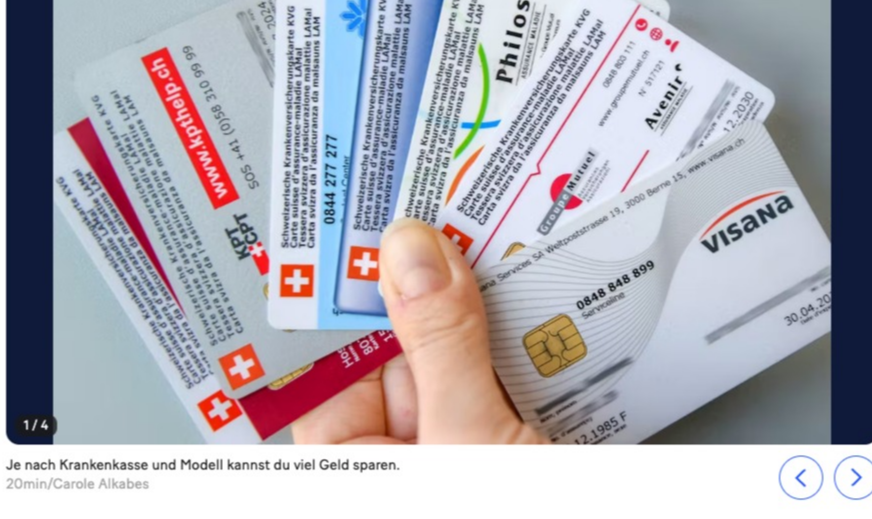
Je nach Krankenkasse und Modell kannst du viel Geld sparen.