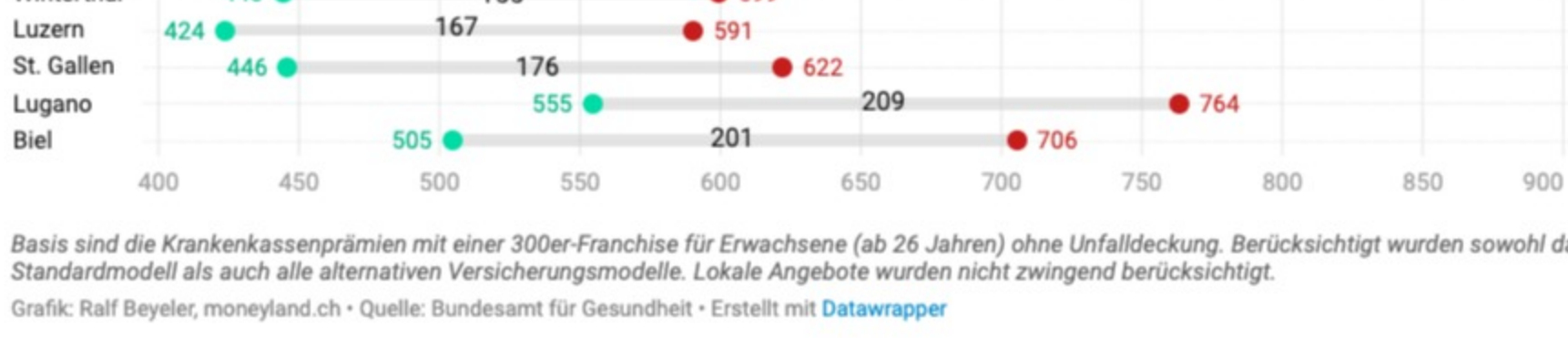
Basis sind die Krankenkassenprämien mit einer 300er-Franchise für Erwachsene (ab 26 Jahren) ohne Unfalldeckung. Berücksichtigt wurden sowohl das Standardmodell als auch alle alternativen Versicherungsmodelle. Lokale Angebote wurden nicht zwingend berücksichtigt. Grafik: Ralf Beyeler, moneyland.ch • Quelle: Bundesamt für Gesundheit • Erstellt mit Datawrapper

So hoch sind die Krankenkassen-Prämien mit 300er-Franchise in den zehn grössten Schweizer Städten.