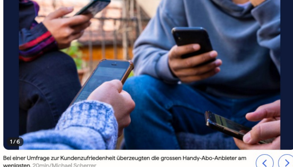
Bei einer Umfrage zur Kundenzufriedenheit überzeugten die grossen Handy-Abo-Anbieter am wenigsten.