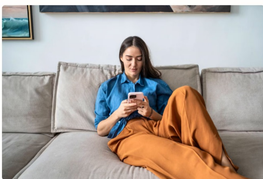
La qualité de l'internet mobile est jugée «très satisfaisante» chez presque tous les fournisseurs.

Frais de roaming exorbitants en comparaison européenne, augmentations de tarif, pannes... Les Suisses ne manquent pas d'occasions de râler contre leur opérateur. Pourtant, leur cote n'est pas si mauvaise, constate le comparateur en ligne Moneyland.ch . L'enquête menée par l'institut Ipsos auprès de 1500 personnes leur donne une note moyenne de 7,9 sur 10. Une légère hausse de 0,1 point par rapport à 2025.